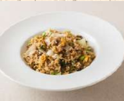
牛挽肉とナス炒飯 1100