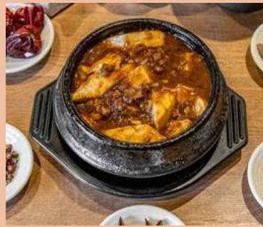
甘味噌麻婆豆腐 単品 1200 丼ぶり 900 ※丼のご飯の量は350g