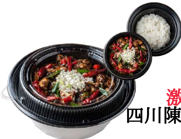
激辛 四川陳麻婆豆腐