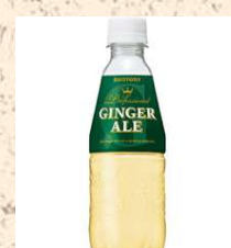
ジンジャーエール330ml 150