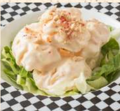
大海老マヨネーズ和え 1500