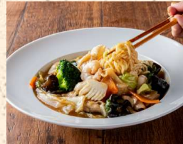
五目あんかけ焼きそば 1500