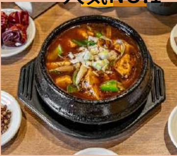
四川陳麻婆豆腐 単品 1200 丼ぶり 900 ※丼のご飯の量は350g