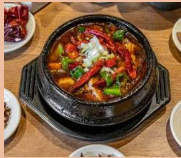
激辛陳麻婆豆腐 単品 1500 丼ぶり 1100 ※丼のご飯の量は350g