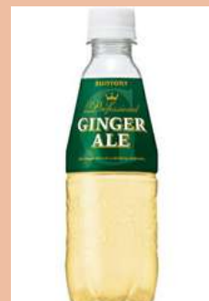
ジンジャーエール330ml 150