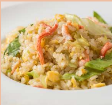
蟹肉とワカメ炒飯 1400