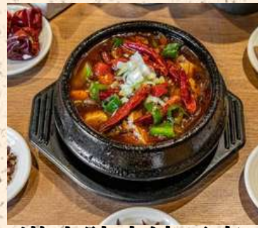
激辛陳麻婆豆腐 単品 1500 丼ぶり 1100 ※丼のご飯の量は350g