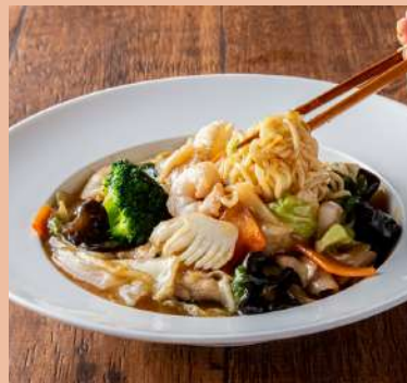
五目あんかけ焼きそば 1500