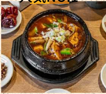
四川陳麻婆豆腐 単品 1200 丼ぶり 900 ※丼のご飯の量は350g