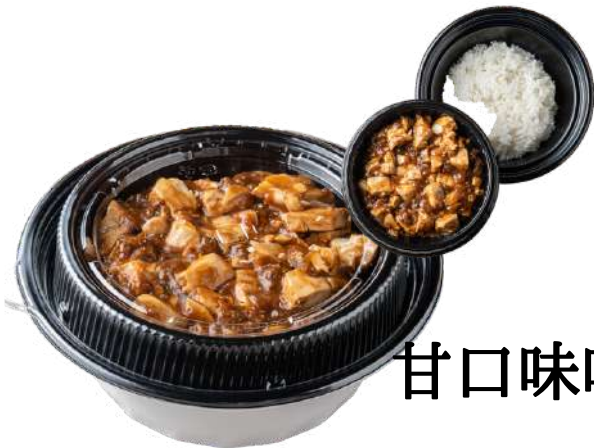
甘口味噌麻婆豆腐